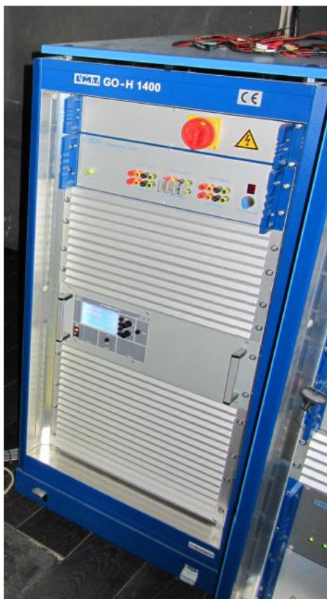
Рисунок 2 - Стойка электропитания