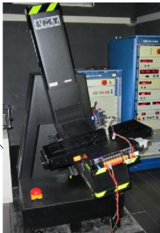
Рисунок 1 - Внешний вид гониометра и его маркировка