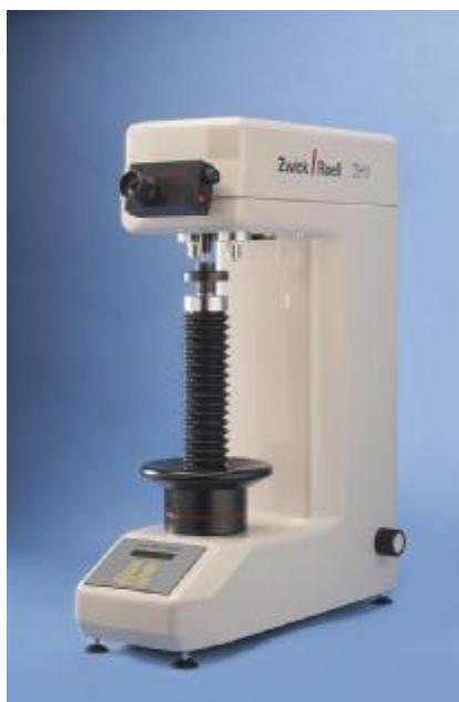
Рис.1 Внешний вид твердомеров Виккерса ZHV 30 и ZHV 50.

Места нанесения пломб и знака утверждения типа приведены на рисунке 2.