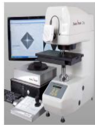
ZHV \mu -A