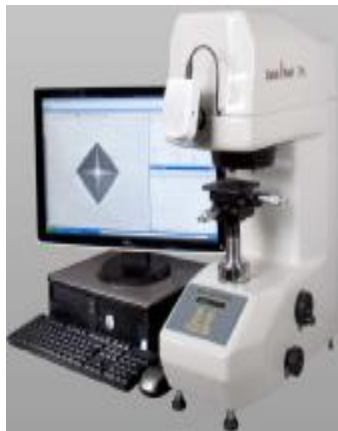
ZHV \mu -S