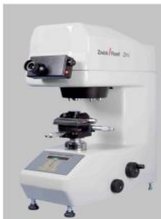
ZHV \mu -M

Внешний вид микротвердомеров приведён на рисунке 1.