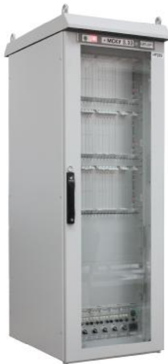
Рисунок 1 – Общий вид комплекса

Схема защиты от несанкционированного доступа представлена на рисунке 2.