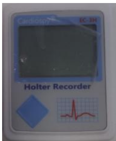
Рисунок 3. Внешний вид системы холтеровского суточного мониторинга EC-3H. Вид спереди