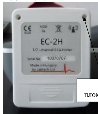
Рисунок 2. Внешний вид системы холтеровского суточного мониторирования ЕС-2Н. Вид сзади