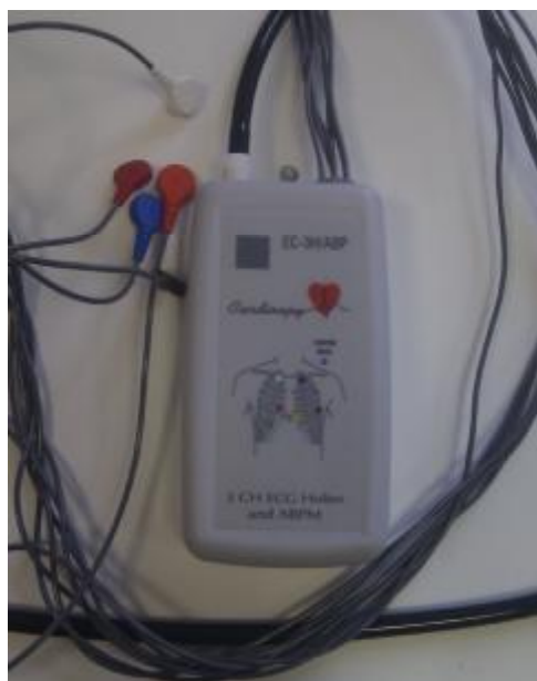
Рисунок 5. Внешний вид системы холтеровского суточного мониторинга EC-3H/ABP. Вид спереди