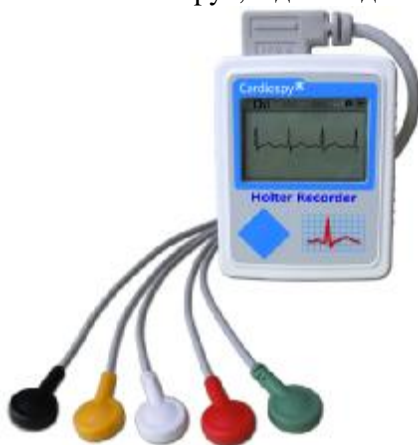
Рисунок 1. Внешний вид системы холтеровского суточного мониторирования ЕС-2Н. Вид спереди

Модели различаются габаритными размерами и дизайном. Модели ЕС-3Н/ABP оборудованы манжетой для измерения АД. В комплектацию моделей ЕС-2Н, ЕС-3Н входит беспроводной интерфейс USB-bluetooth, в комплектацию моделей ЕС-3Н/ABP беспроводной интерфейс USB-INFRA. Для моделей с каналом артериального давления предусмотрено автономное ПО «Labtech Ltd. Cardiospy», а для моделей без него «Cardiospy ECG Holter».