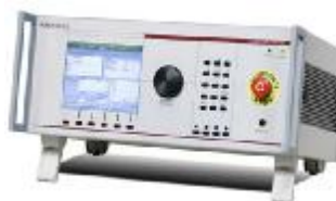
Рисунок 1 – Внешний вид аппаратуры для измерений механических воздействий и управления процессом проведения испытаний изделий машиностроения модели Portable Test Controller

Внешний вид аппаратуры модели Portable Test Controller приведен на рисунке 1, внешний вид кейса для восьмиканальной аппаратуры модели Aerospace Test Controller приведен на рисунке 2.