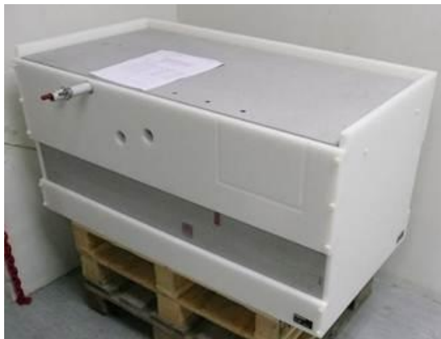
Рисунок 1. Внешний вид мер толщины бетонных РТ 1000, Detection block

Чертежи с геометрическими размерами и расположением искусственных дефектов в мерах бетонных РТ 1000, Detection block приведены на Рисунке 2.