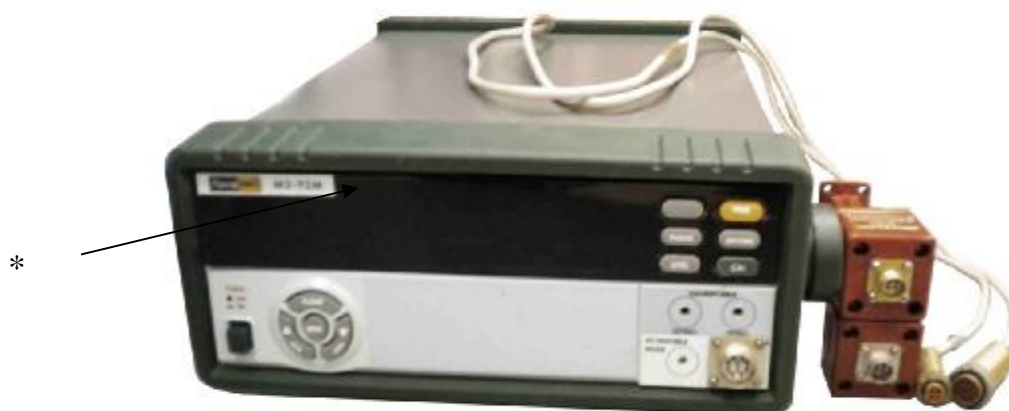
Рисунок 2. Внешний вид измерителя мощности МЗ-92М