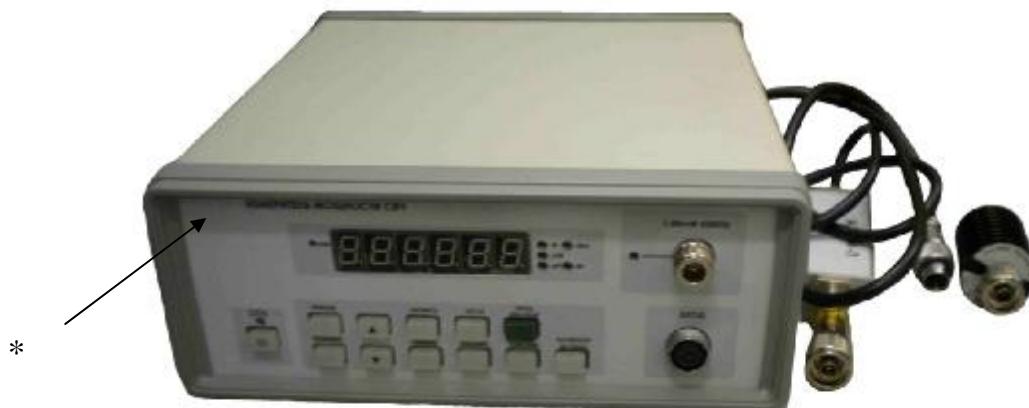
Рисунок 1. Внешний вид измерителей мощности МЗ-90М, МЗ-93М, МЗ-95М

Места пломбировки от несанкционированного доступа измерителей мощности изображены на рисунке 3.