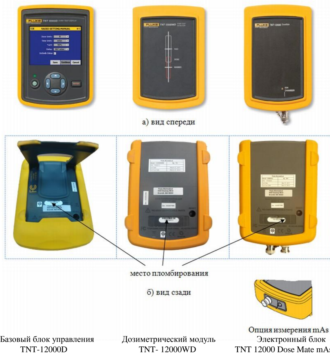
Рисунок 1. Общий вид дозиметра TNT 12000

Фотография общего вида дозиметра TNT 12000 приведена на рисунке 1.