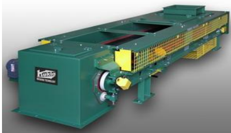
ГПУ дозатора E-DBW-A