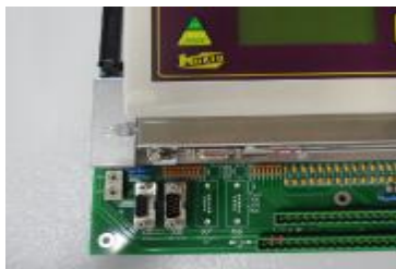
Рисунок 2 — Схема пломбировки от несанкционированного доступа