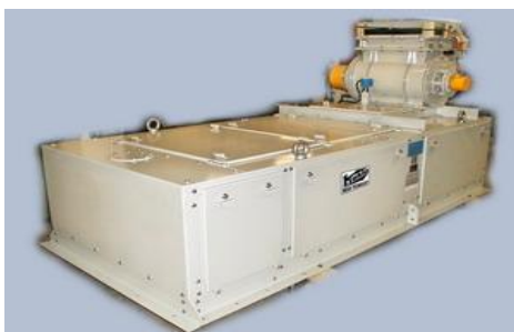
ГПУ дозатора E-DBW-H

Общий вид дозаторов приведен на рисунке 1.