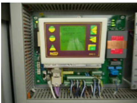
Весоизмерительный прибор DWC-5C