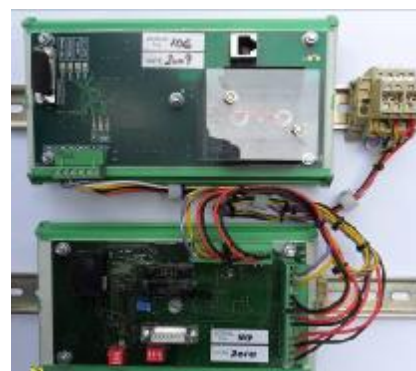
Модуль преобразования MW- EIP