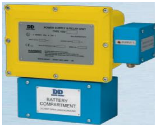
Блок питания PC 21

Модуль телеметрии PC21-2T и барьер искробезопасности