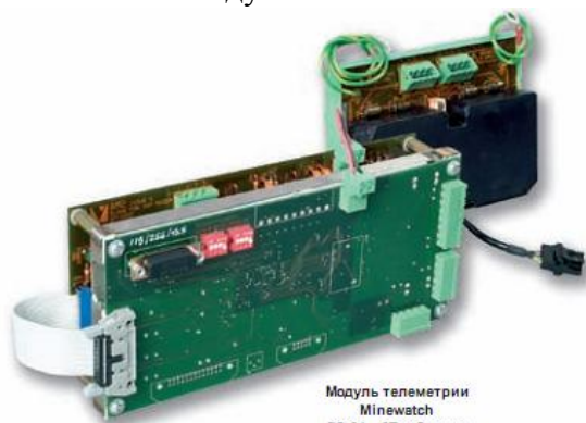
Модуль телеметрии Minewatch PC 21 – 2T и барьер искробезопасности