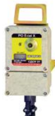
Датчик токсичных газов стационарный СДТГ