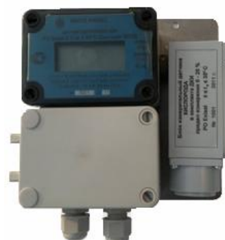
Датчик кислорода искробезопасный ДКИ