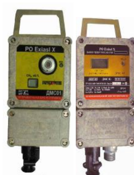
Датчики метана стационарные ДМС 01, ДМС 03