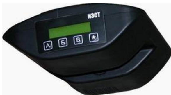
Измеритель запыленности стационарный ИЗСТ-01