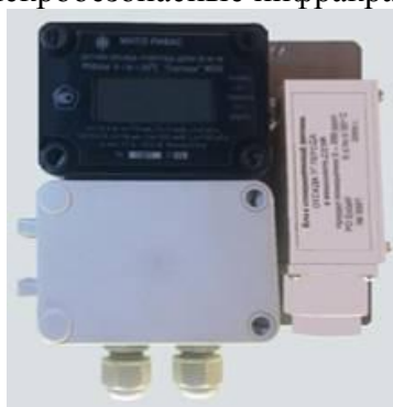
Датчик оксида углерода искробезопасный ДОУИ