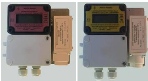
Датчики искробезопасные инфракрасные ИДИ