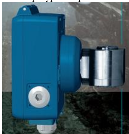
Датчик дифференциального давления ТХ 6143