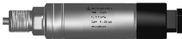
Датчик давления МИДА-13П