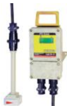
Датчик скорости воздушного потока СДСВ 01