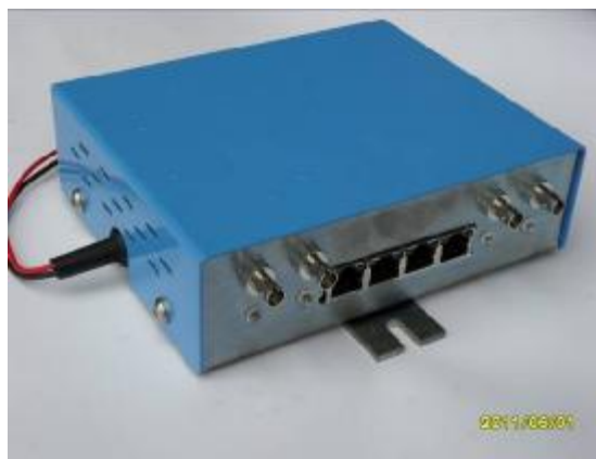
Модуль медиаконвертора MW-МК