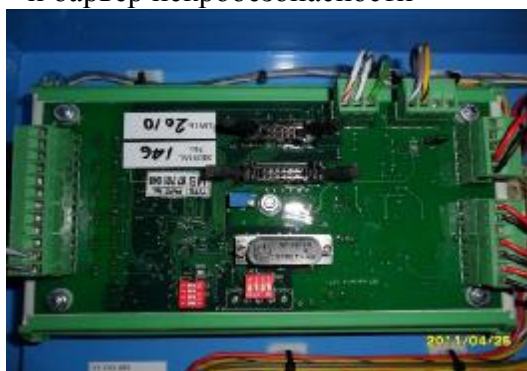
Модуль преобразования MW-MS

Модуль телеметрии PC21-2T и барьер искробезопасности