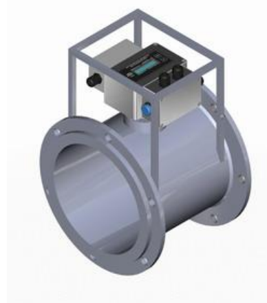
Система контроля параметров дегазационной сети СКПДС