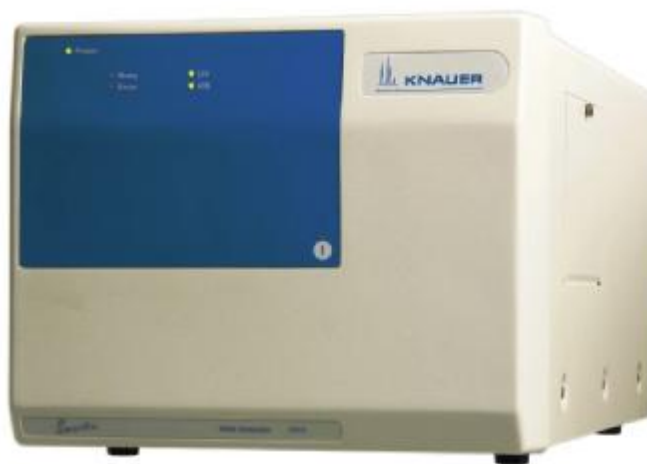
Рис. Внешний вид детектора на диодной матрице Smartline UV 2850.