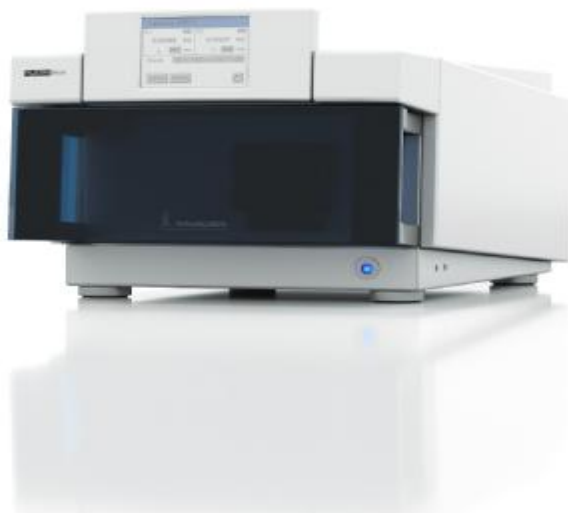
Рис. Внешний вид детектора спектрофотометрического PLATINblue MW-1.