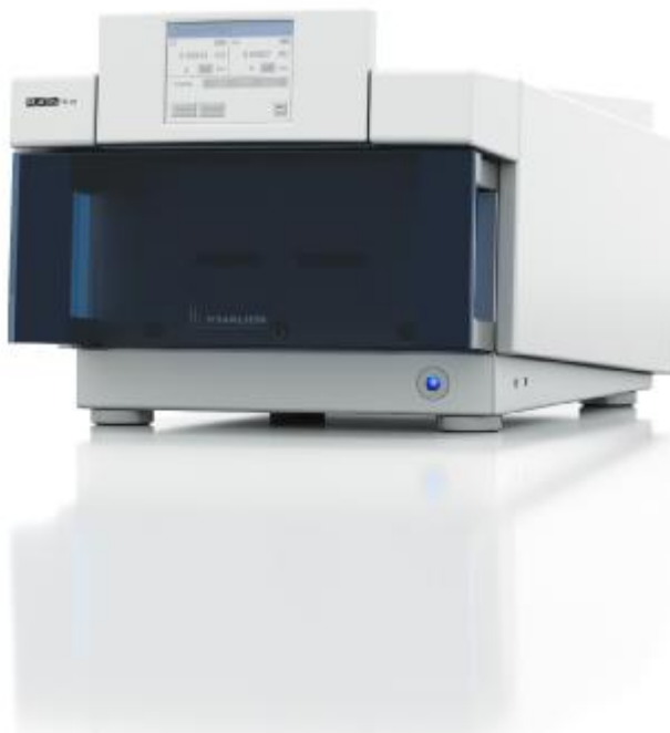
Рис. Внешний вид детектора на диодной матрице PLATINblue PDA-1.