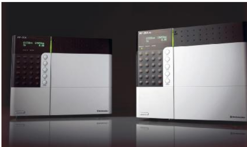
Рис. Внешний вид детектора спектрофлуориметрического RF-20 A/20 Axs.