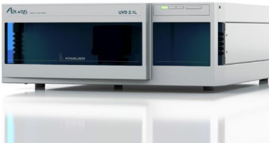
Рис. Внешний вид детектора спектрофотометрического Azura UVD 2.1L.