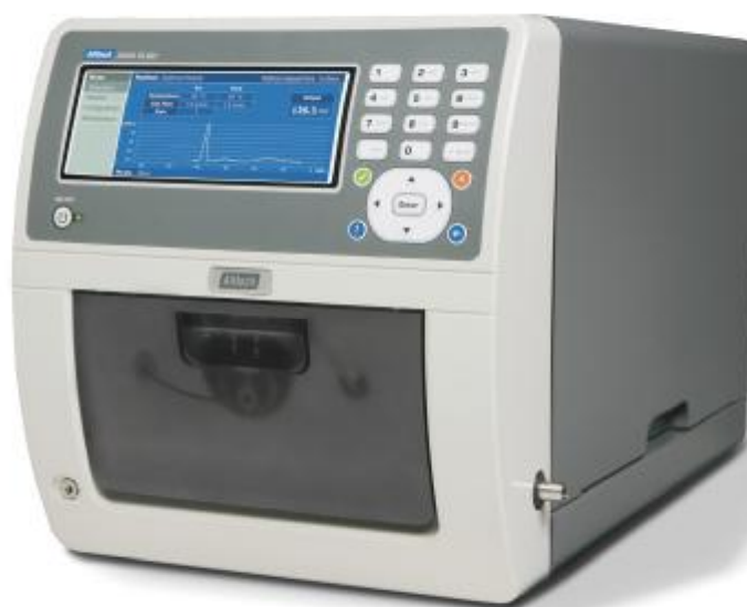
Рисунок 4. Внешний вид детектора по светорассеянию ELSD 3300.