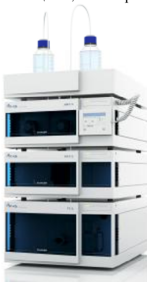
Рисунок 1. Внешний вид хроматографа жидкостного высокоэффективного "KNAUER".

Принцип действия детектора по светорассеянию ELSD 3300 основан на распылении поступающего из колонки элюата с последующим испарением подвижной фазы и детектированием степени светорассеяния частицами пробы. В качестве источника излучения используется лазерный диод с коллиматорной оптикой при длине волны 650 нм. Максимальная выходная мощность источника менее 30 мВт, в качестве детектора - кремниевый фотодиод. Хроматографы с детектором ELSD 3300 применяют для анализа веществ, не поглощающих УФ излучение – сахаров, жиров, поверхностно-активных веществ, полимеров, аминокислот и пептидов.