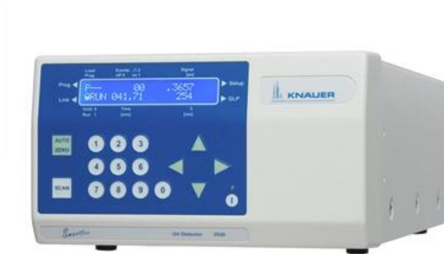
Рис.2. Внешний вид детектора спектрофотометрического Smartline UV 2520.