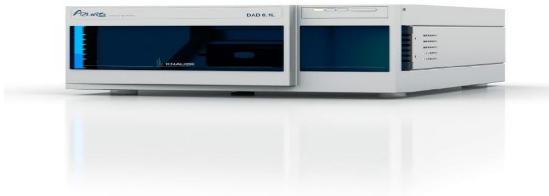
Рис. Внешний вид детектора на диодной матрице Azura DAD 6.1 L.