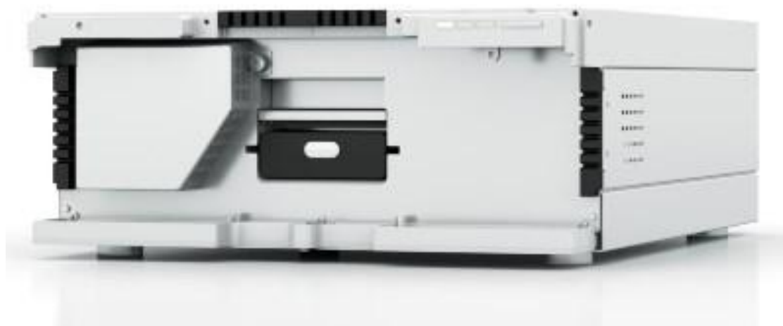
Рис. Внешний вид детектора спектрофотометрического Azura MWD 6.1 L.