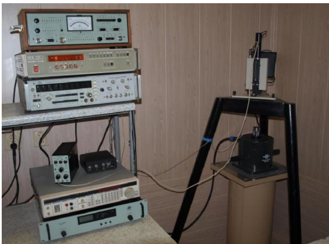
Рис. 1. Внешний вид виброустановки