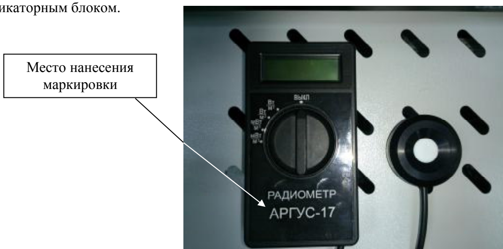
Рисунок 1 - Общий вид радиометра «Аргус-17» и место нанесения маркировки

Принцип действия радиометра основан на преобразовании потока излучения в диапазоне длин волн 0,465 \pm 0,013 мкм в электрический сигнал, пропорциональный энергетической освещенности. Конструкция радиометра включает индикаторный и измерительный блоки. Измерительный блок радиометра соединяется электрическим кабелем с индикаторным блоком.