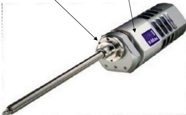
Рисунок 2 – Отдельное фото микроанализатора