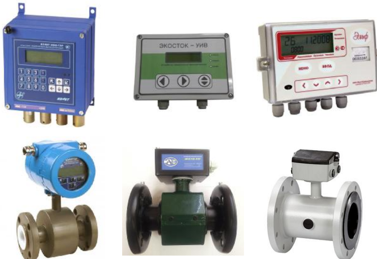
Рисунок 1 - Общий вид комплексов различных исполнений.

Общий вид комплексов приведен на рисунке 1.