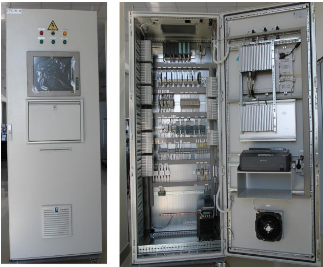
Рисунок 2. Внешний вид шкафа СТК-ЭР-М

Внешний вид шкафа СТК-ЭР-М представлен на рисунке 2.