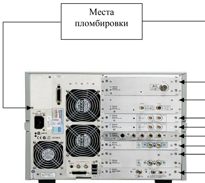
Рисунок 2 – Схема пломбировки анализаторов (задняя панель)