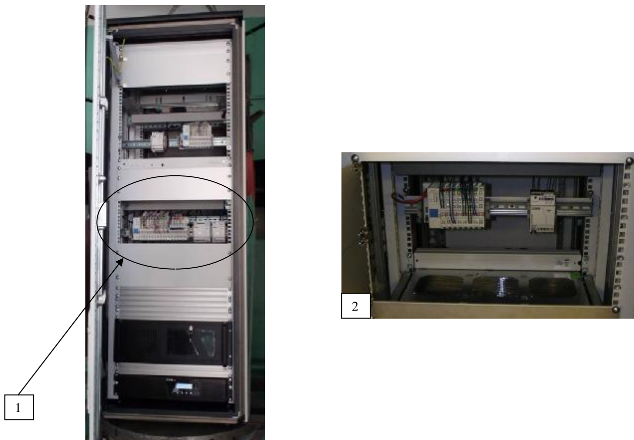
Рисунок 2 – УИ-ГЦ в стойке шкафа технических средств: вид сзади (1) и спереди (2))