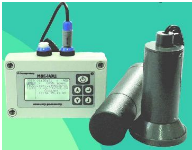
Рисунок 1 – Внешний вид МКС-14ЭЦ

Пломбирование пульта электронного и блоков детектирования БДГ-01 и БДБ-01 должно осуществляться клейким стикером, на котором должны быть нанесены: