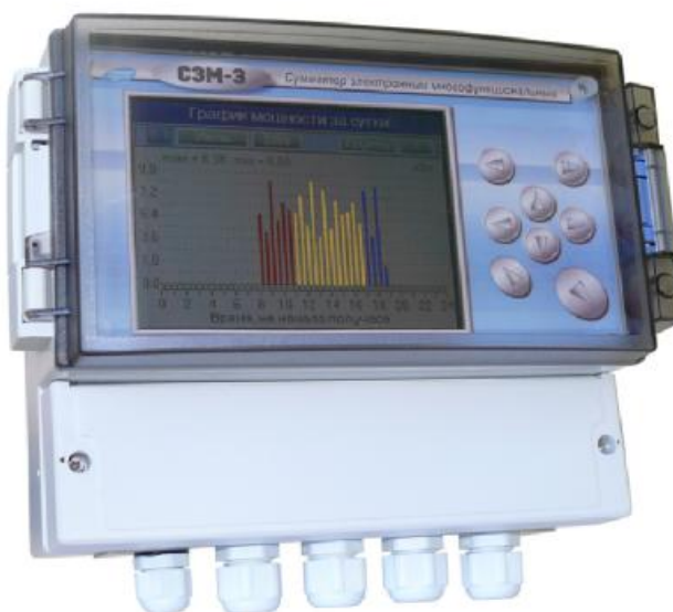
Рисунок 1 – Общий вид сумматоров СЭМ-3

Сумматор может использоваться энергоснабжающими предприятиями, а также диспетчерскими службами энергосистем для оперативного измерения и сбора информации о выработке и потреблении электроэнергии и введения ограничений на ее потребление.