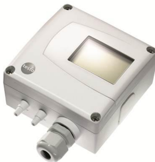
Рисунок 2 - Преобразователь дифференциального давления Testo 6321