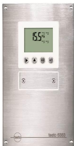
Рисунок 1 - Преобразователь дифференциального давления Testo 6383

Защита программного обеспечения от непреднамеренных и преднамеренных изменений соответствует уровню «А» по МИ 3286-2010.