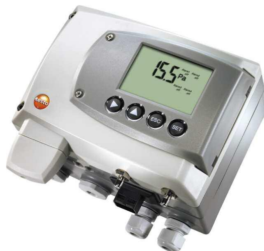
Рисунок 4 - Преобразователь дифференциального давления Testo 6351