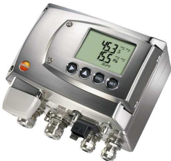
Рисунок 3 - Преобразователь Дифференциального давления Testo 6381