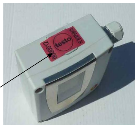
Рисунок 6 - Преобразователь дифференциального давления Testo 6321