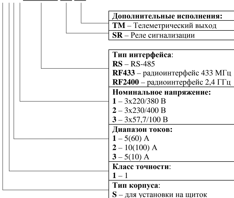
Рисунок 1 - Структура условного обозначения счетчиков