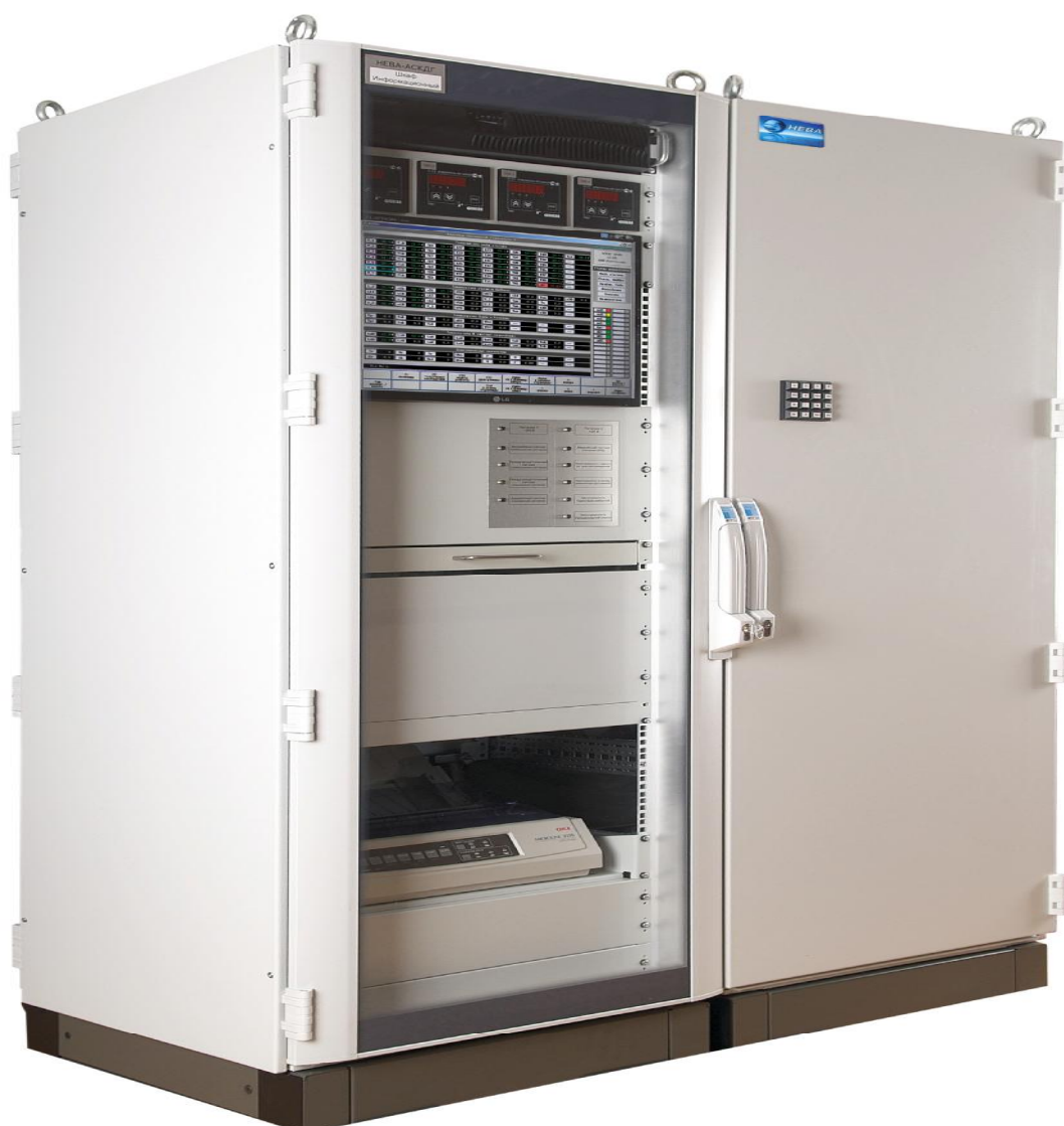
Рисунок 1- Внешний вид комплекса «НЕВА-АСКДГ»