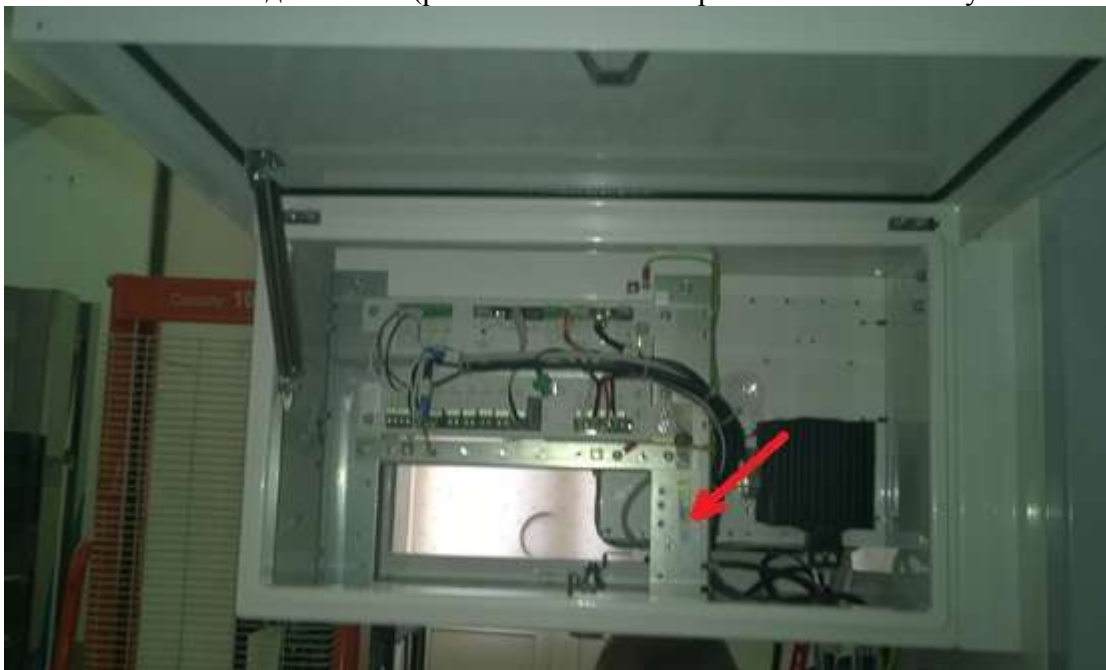
Рисунок 4 - место нанесения знака поверки