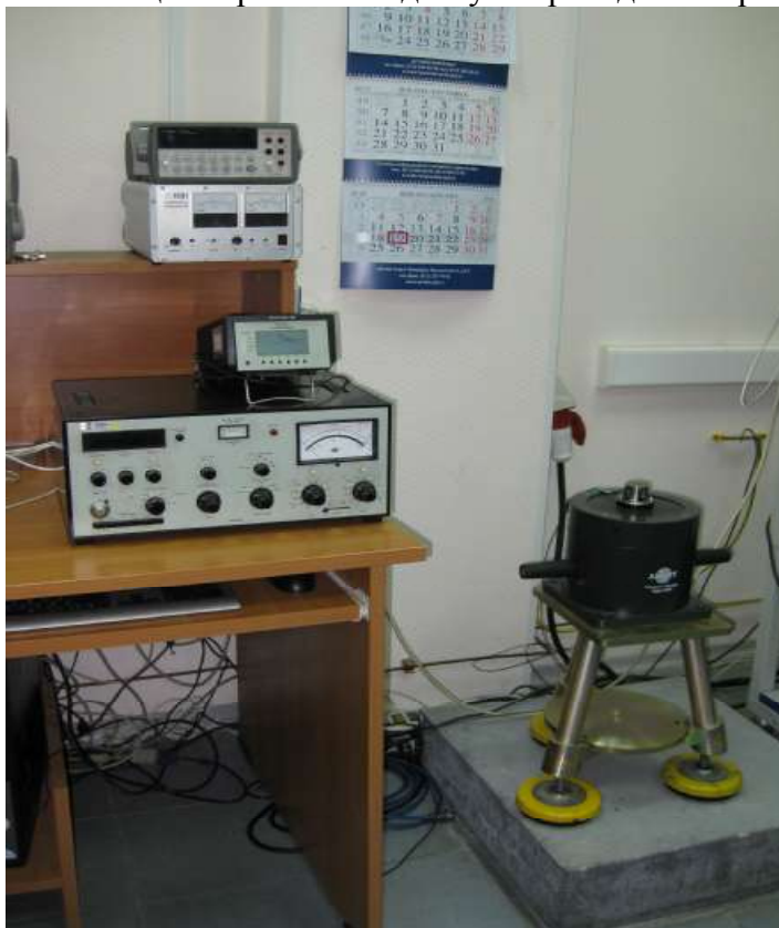
Рисунок 1 - Внешний вид виброустановки

Схема защиты от несанкционированного доступа приведена на рис. 2.