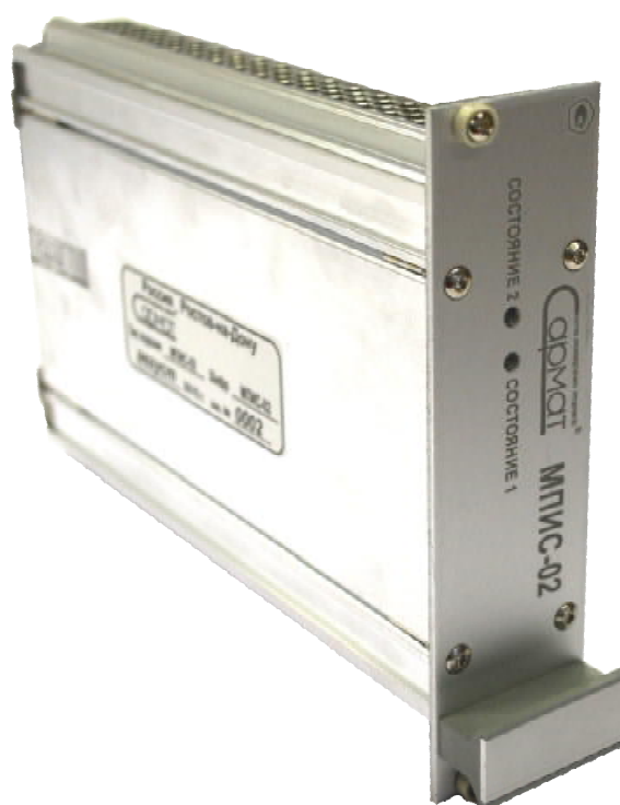
Рисунок 1 - Фотография общего вида модуля преобразователя измерительного скорости МПИС-02

Общий вид изделия и расположение мест для нанесения пломбы производителя показаны на рисунках 1 - 4.