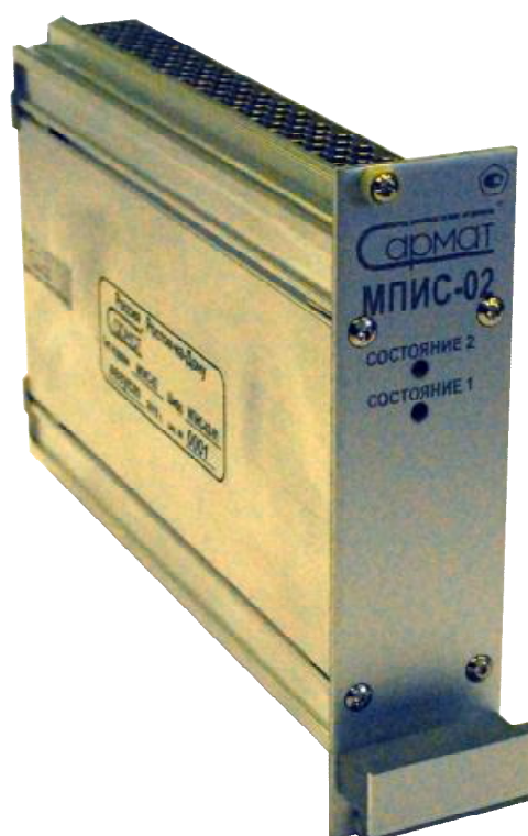
Рисунок 3 - Фотография общего вида модуля преобразователя измерительного скорости МПИС-02-01