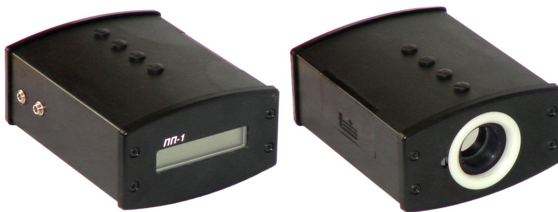
Рисунок 1 - Внешний вид пирометра ПП-1

Внешний вид пирометра представлен на рисунке 1. Места размещения знака утверждения типа и пломб для защиты от несанкционированного доступа указаны на рисунке 2.