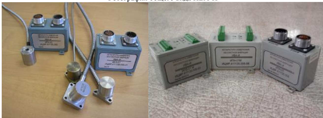
Фотография общего вида ИВА-И