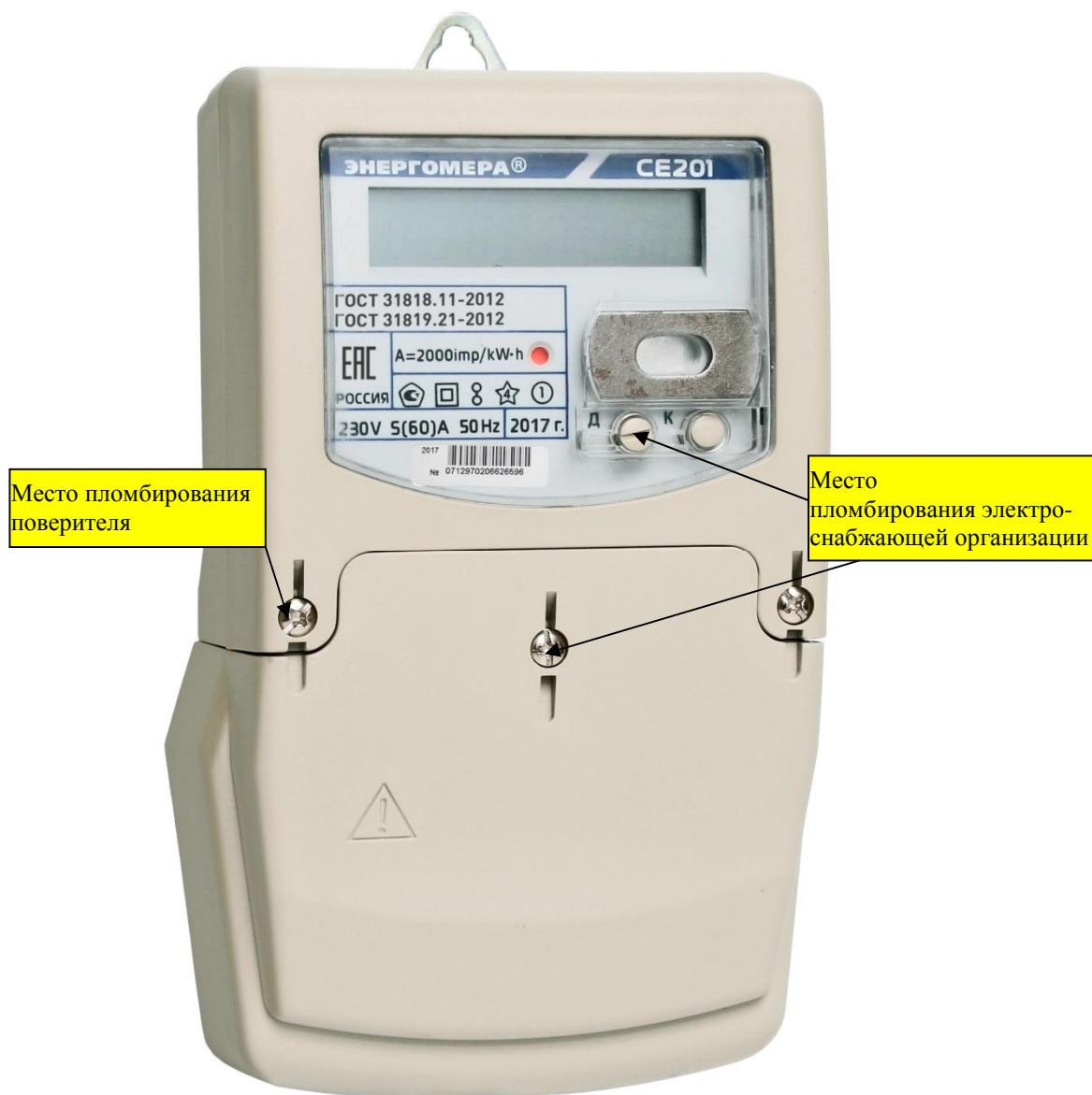
Рисунок 3 - Общий вид счетчика CE 201 S7