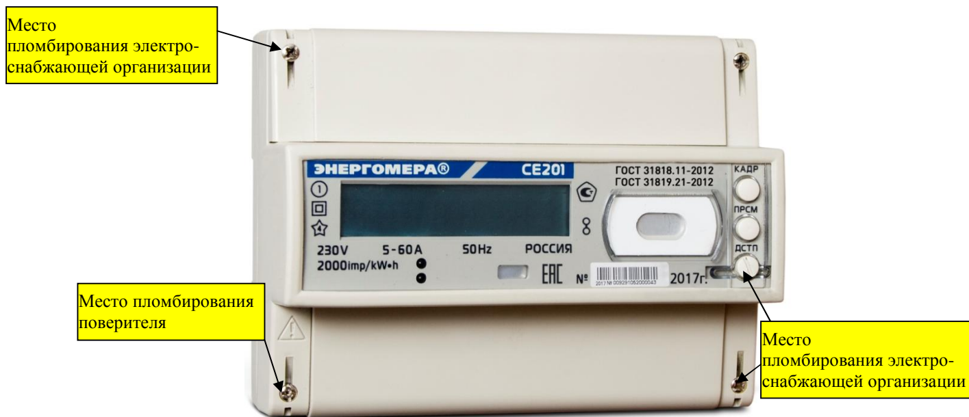
Рисунок 2 - Общий вид счетчика CE 201 R8