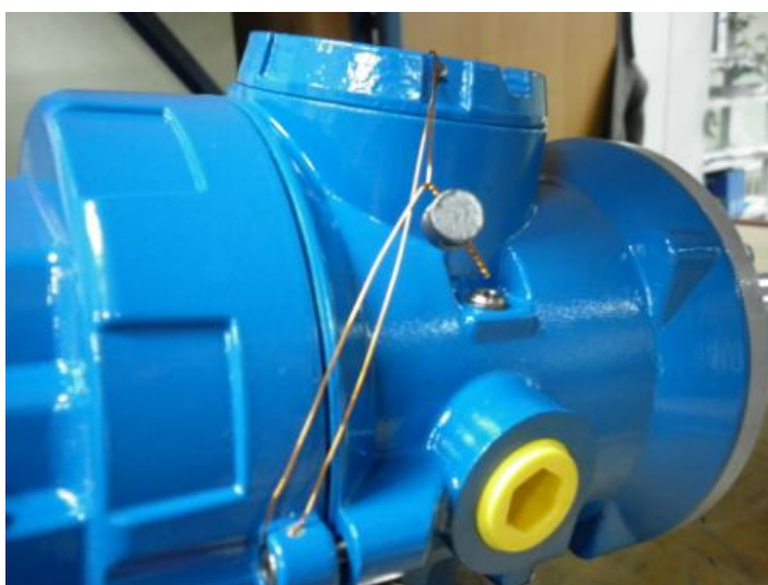
Рисунок 2 - Места нанесения поверительных клейм (наклеек и пломб)