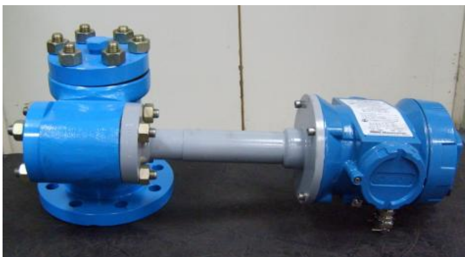
Рисунок 1 - Внешний вид датчика уровня (без буйки)

Фотографии внешнего вида датчика уровня и места нанесения поверительных клейм (наклеек и пломб)