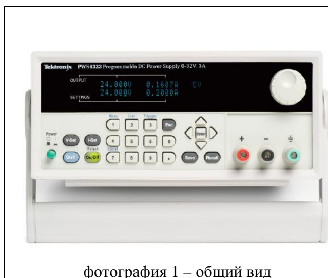
фотография 1 – общий вид

По техническим требованиям источники питания программируемые серии PWS4000 соответствуют ГОСТ 22261-94, по требованиям к климатическим и механическим воздействиям – группе 3 ГОСТ 22261-94 с диапазоном рабочих температур от 0 до + 40 °С.