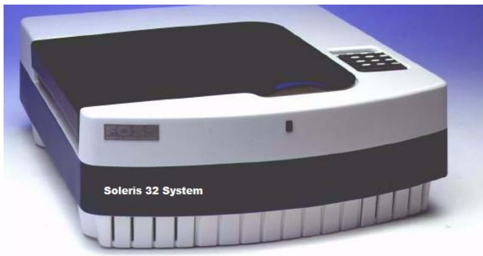
Рисунок 1 – Общий вид Спектрофотометра Soleris 32.

Модификации Soleris 32 и Soleris 128 различаются количеством ячеек для анализа (32 и 128 соответственно), а так же наличием одного или четырех термостатов соответственно.