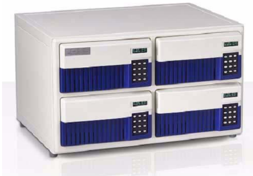
Рисунок 2 – Общий вид Спектрофотометра Soleris 128.