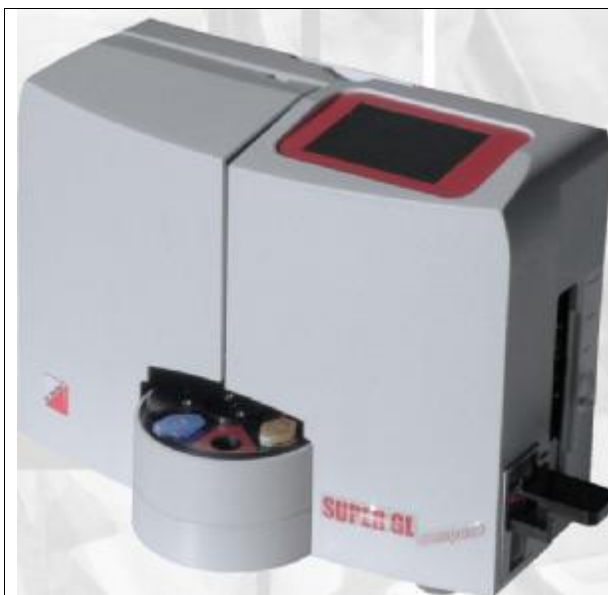
Рисунок 1 – Анализатор глюкозы и лактата SUPER GL compact