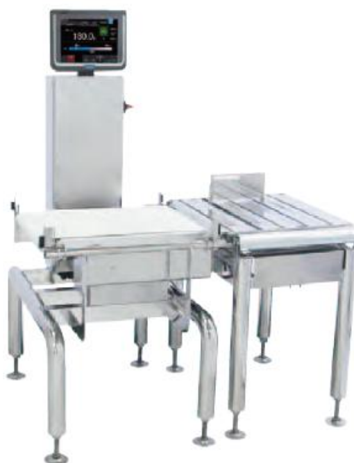
Рисунок 1 - Внешний вид средства измерений (примеры)