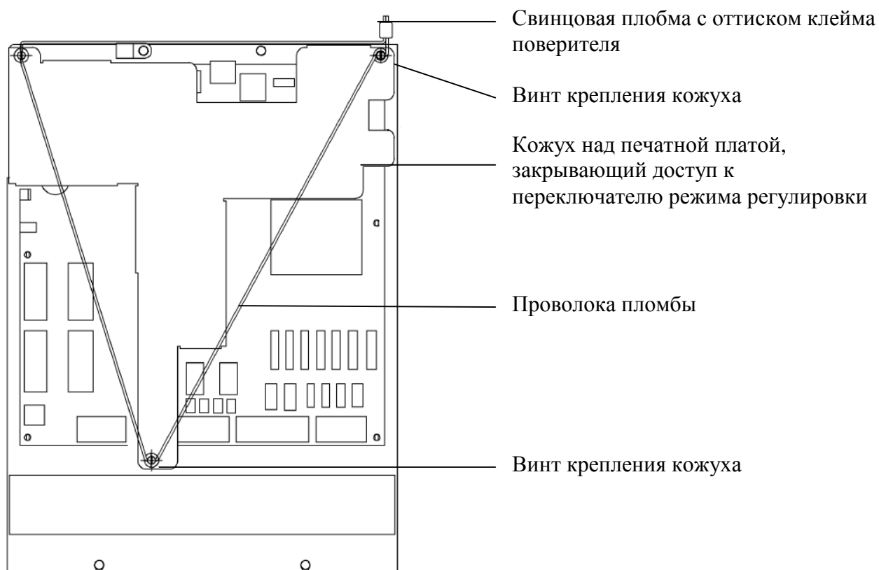
Рисунок 2 - Схема пломбировки печатной платы электронного устройства обработки измерительной информации и управления

Схема пломбировки от несанкционированного доступа и обозначение места нанесения знака поверки представлены на рисунках 2 и 3.