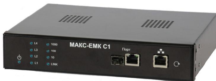
Рисунок 1 - Общий вид тестера в исполнении «МАКС-ЕМК С1»