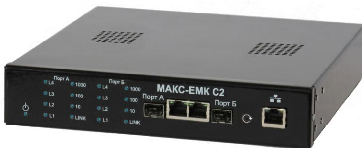
Рисунок 2 - Общий вид тестера в исполнении «МАКС-ЕМК С2»