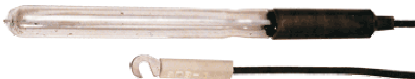
Рис. 1 Общий вид электродов платиновых высокотемпературных ЭПВ-1

При погружении электрода в контролируемый раствор на границе платинового электрода и раствора возникает потенциал, зависящий от изменения окислительно-восстановительной способности растворов (активности электронов в растворе). В зависимости от системы подключения выпускаются электроды с наконечником ЭПВ-1 и с кабельной вилкой ЭПВ-1СР. Знак поверки (оттиск поверительного клейма) наносится на паспорт электродов. Электроды работают в паре с любым вспомогательным электродом и рассчитаны для работы как в промышленных условиях, так и в лабораторной практике.