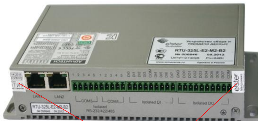
Пломбы в виде наклеек