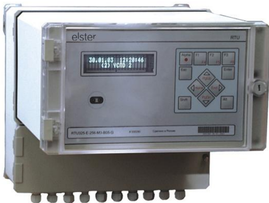
Рисунок 1 – Фотография общего вида УСПД RTU-325

УСПД обеспечивают автоматическую проверку работоспособности счетчиков с самотестированием с записью в журнал событий УСПД.