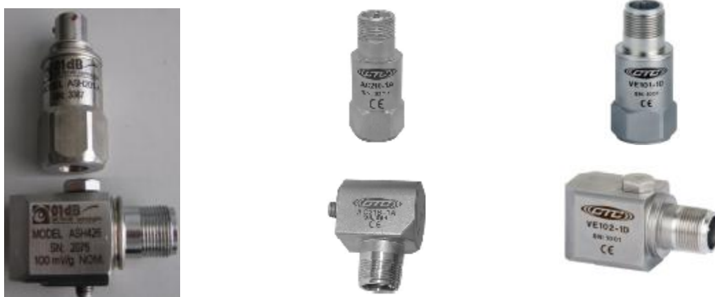
ASH-2xx и ASH-4xx

Внешний вид вибропреобразователей пьезоэлектрических приведен на рисунке 2.