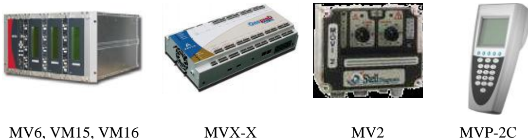
MV6, VM15, VM16

Внешний вид контроллеров серии MV* и серии VM* приведен на рисунке 4.