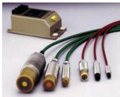
Рисунок 3 – Внешний вид преобразователей вихретоковых

Внешний вид преобразователей вихретоковых приведен на рисунке 3.