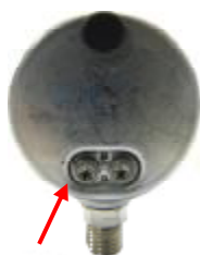
Рис. 4. Место нанесения клейма (пломбы) на калибратор давления CPG1000

Места нанесения пломб указаны на рисунках 4 и 5.