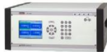
Рис. 3. Калибратор давления CPG8000