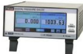
Рис. 2. Калибратор давления CPG2500