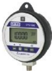
Рис. 1. Калибратор давления CPG1000

Посредством интерфейсов IEEE-488.2, RS-232, Ethernet возможна коммутация с другими устройствами и связь с компьютером. Программное обеспечение калибраторов CPG8000 и CPG2500 позволяет автоматизировать и документировать процессы поверки, калибровки и испытаний. Программное обеспечение калибратора CPG1000 позволяет документировать рез