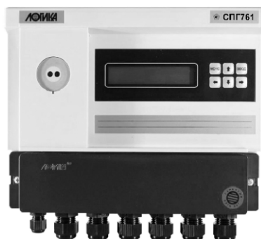
Рисунок 1 - Корректор СПГ761 (СПГ762)