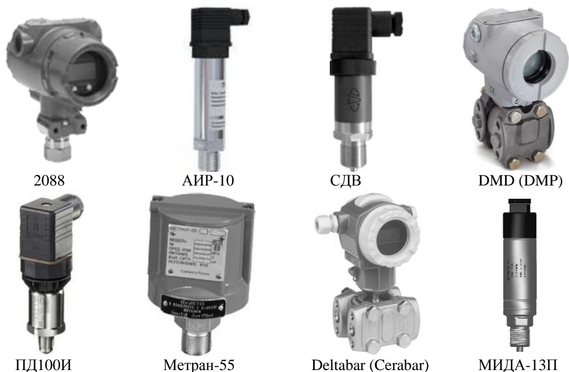
Рисунок 4 (продолжение) - Преобразователи давления и разности давлений