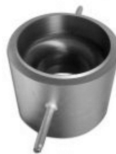
Сопло ИСА 1932