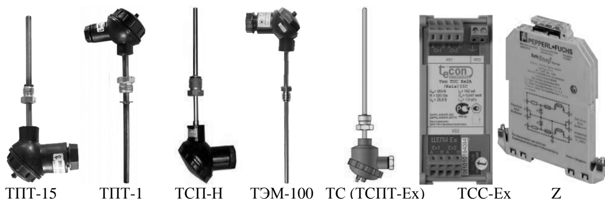
Рисунок 5 - Преобразователи температуры