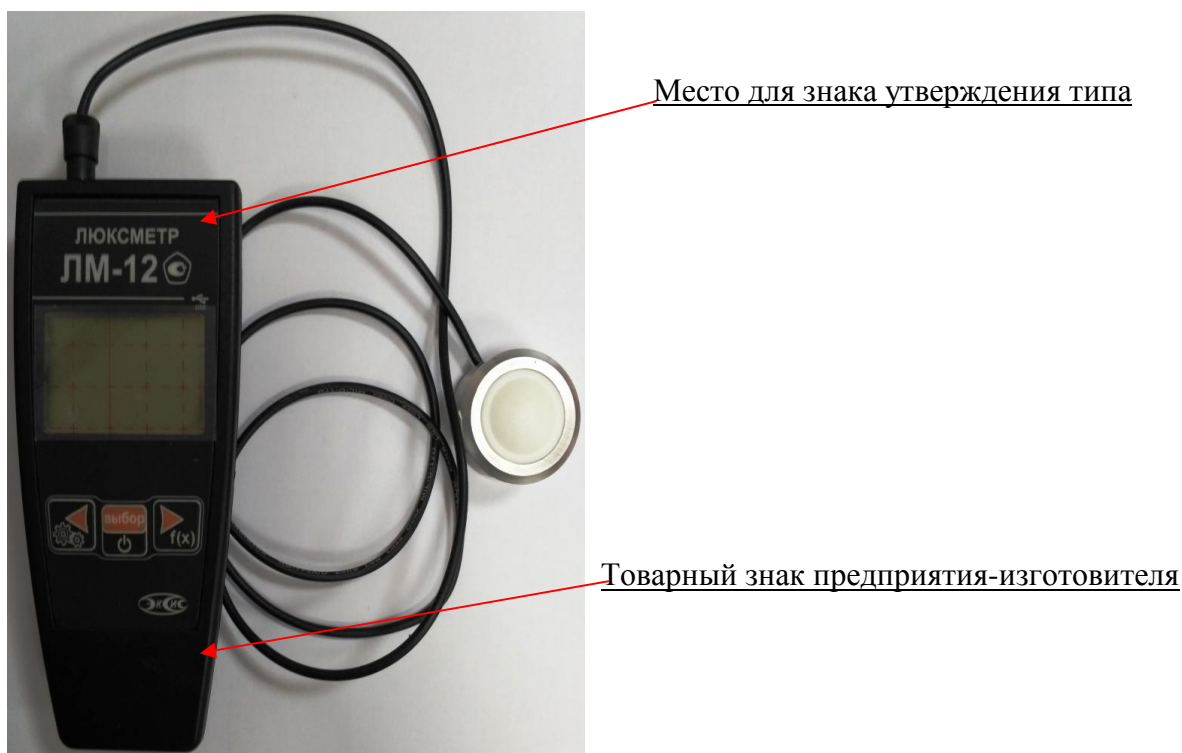
Рисунок 1 - Общий вид люксметров ЛМ-12

Схема пломбирования люксметров ЛМ-12 от несанкционированного доступа приведена на рисунке 2.