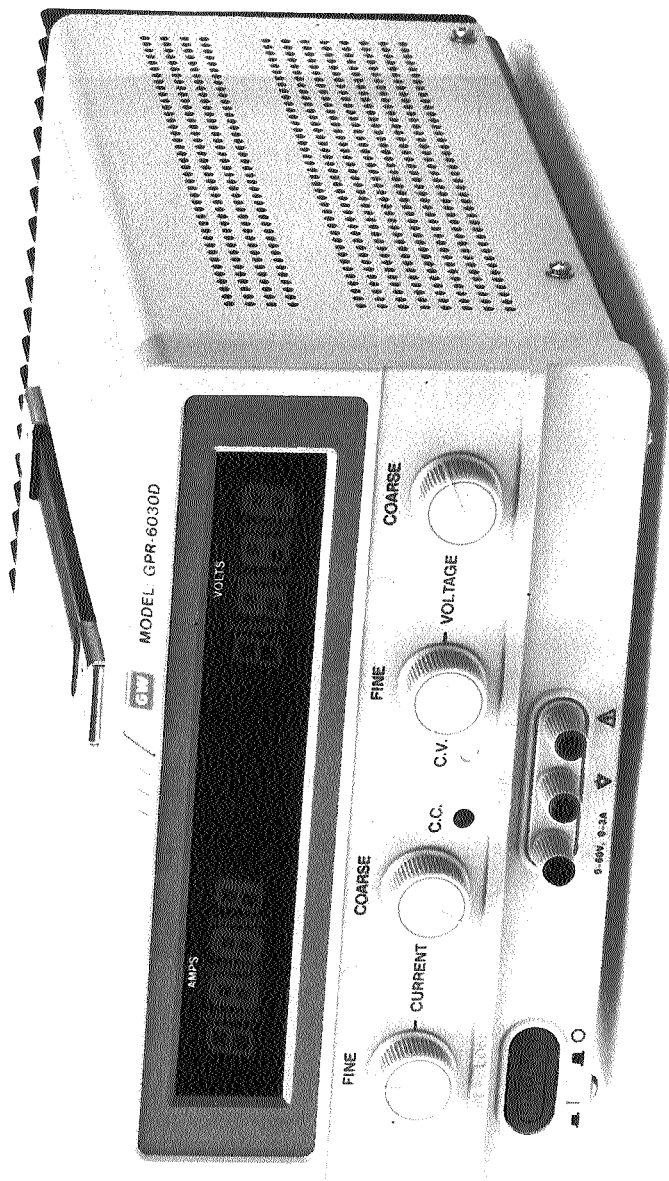
Источник питания GPR-6030D