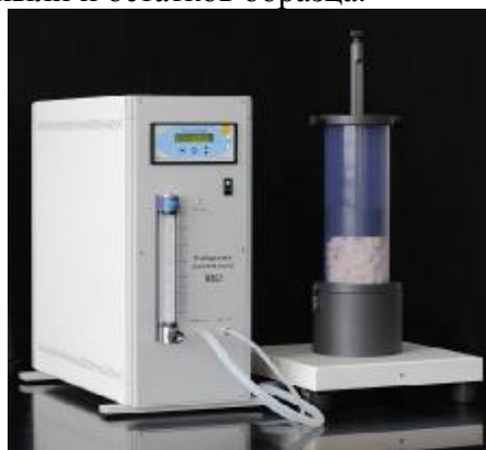
Рисунок 1 – Общий вид измерительного комплекса РА-SW

После окончания работы комплекса необходимо закрыть игольчатый клапан на ротаметре и выключить прибор с помощью главного переключателя. Удалить образец и очистить рабочие поверхности от пыли и остатков образца.