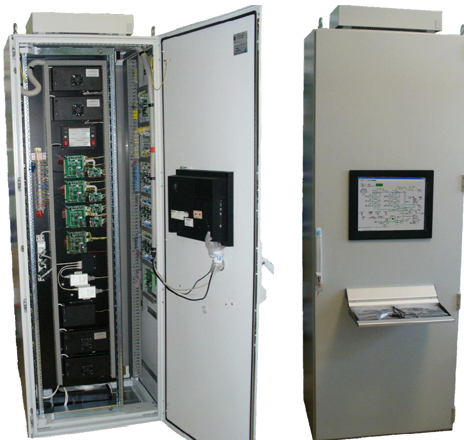
Рисунок 1.1 – Шкаф управления ПТК «Космотроника - Венец»