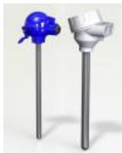
W-A- Ø, W-A- Ø-U