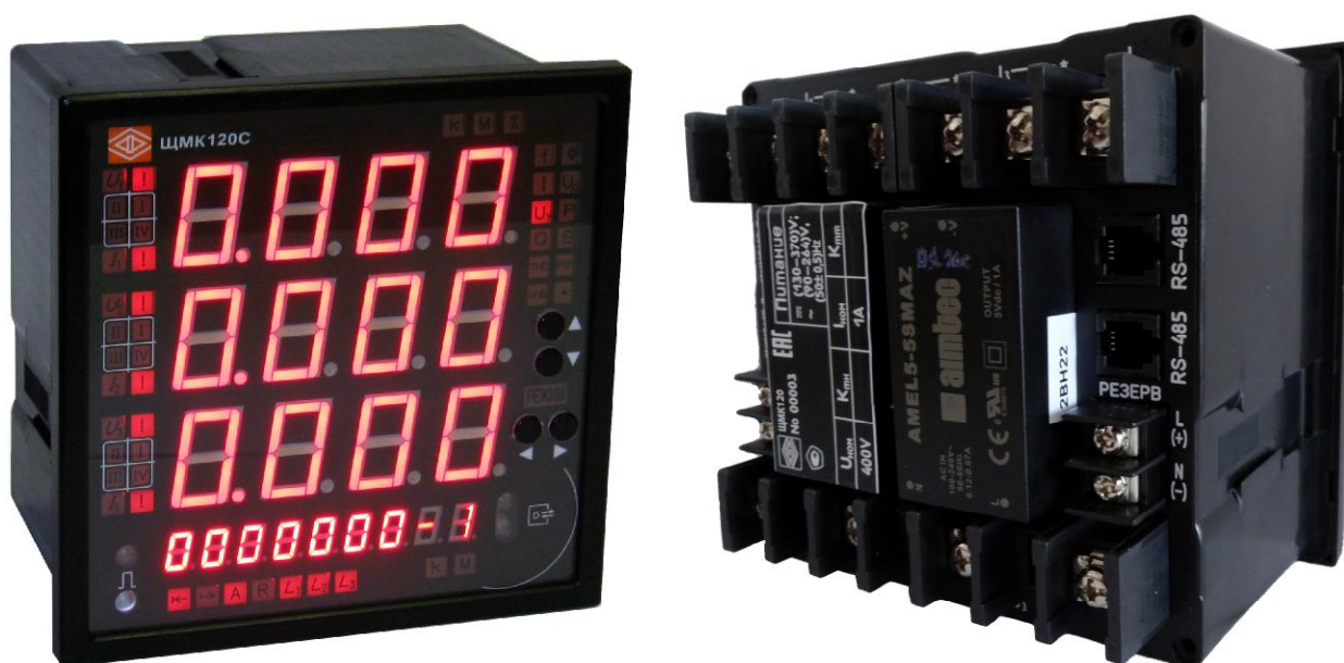
Рисунок 1б - Общий вид приборов ЦМК120С с функцией коммерческого учета электроэнергии