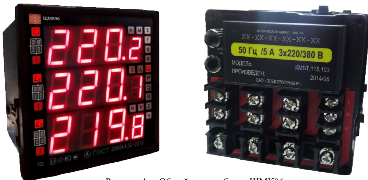
Рисунок 1а - Общий вид приборов ЦМК96

Общий вид приборов, места нанесения маркировки и клейм приведены на рисунках 1, 2.