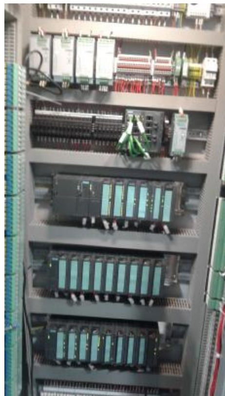
Рисунок 3 - Общий вид шкафа управления