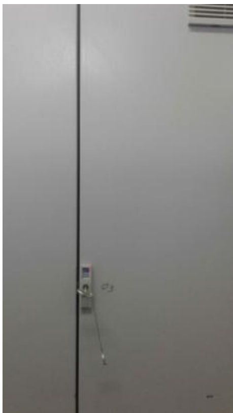
Рисунок 2 - Общий вид запирающегося шкафа управления