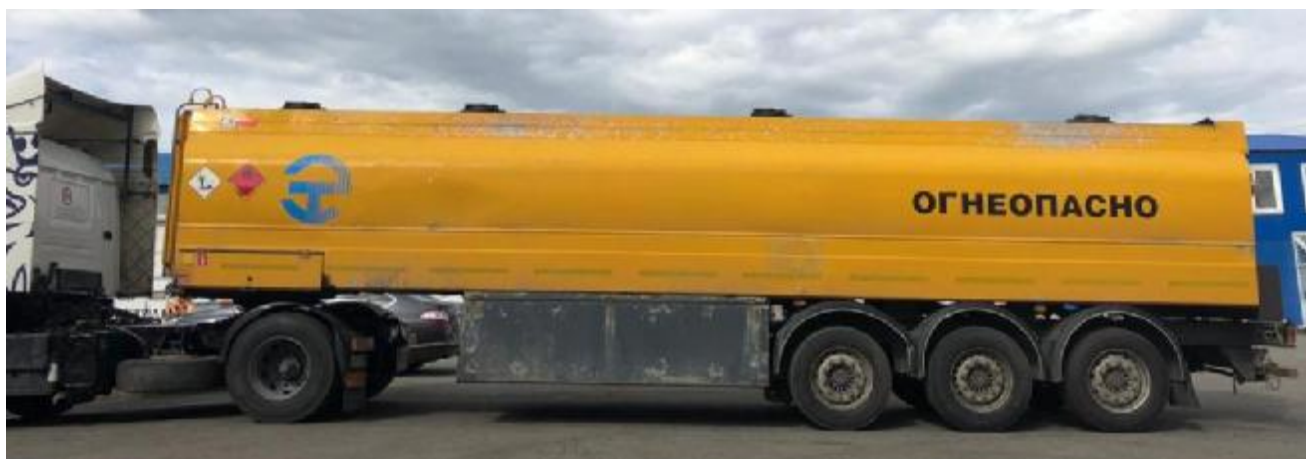
Рисунок 1 - Общий вид полуприцепа-цистерны Eurotank

Общий вид полуприцепа-цистерны представлен на рисунке 1.