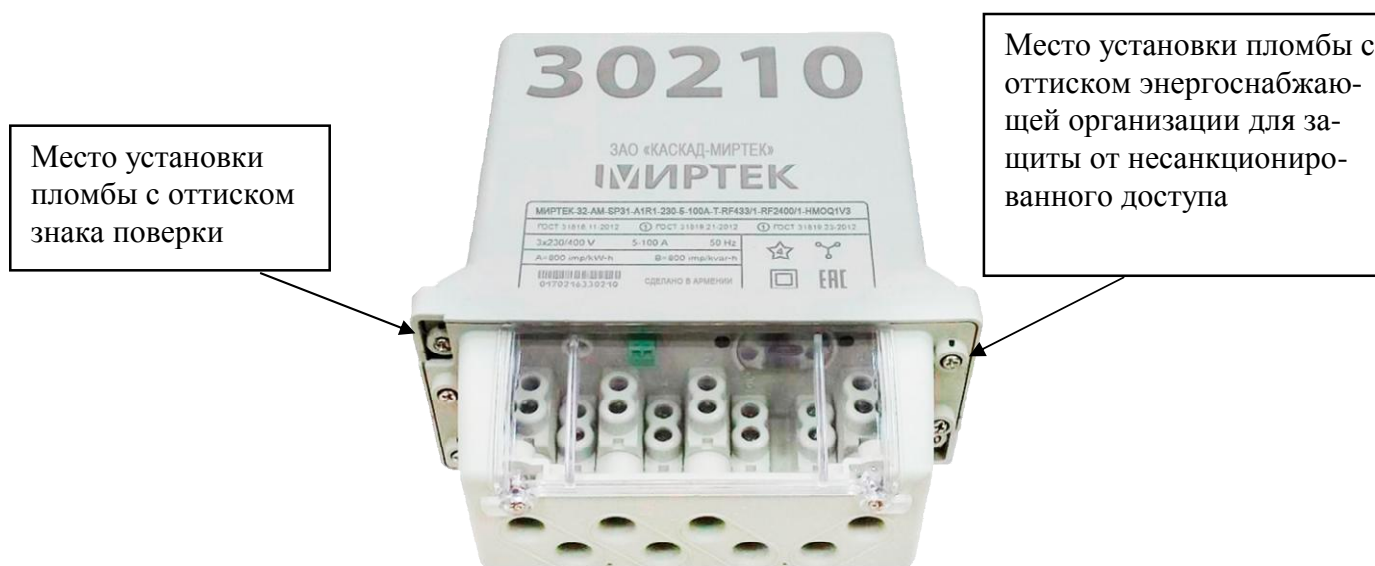
Рисунок 8 – Общий вид счетчика и схема пломбировки от несанкционированного доступа в корпусе типа SP31