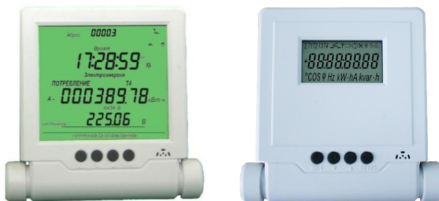
Рисунок 9 – Общий вид дистанционного индикаторного устройства