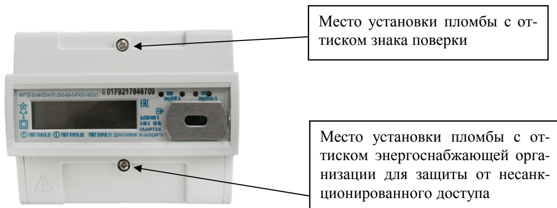
Рисунок 5 – Общий вид счетчика и схема пломбировки от несанкционированного доступа в корпусе типа D33