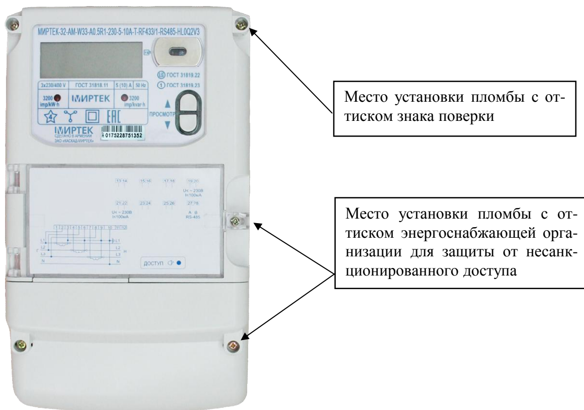
Рисунок 3 – Общий вид счетчика и схема пломбировки от несанкционированного доступа в корпусе типа W33