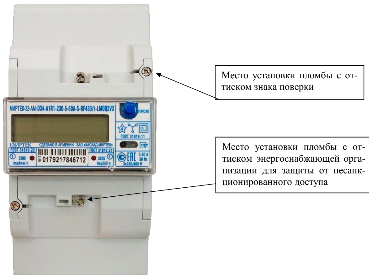
Рисунок 6 – Общий вид счетчика и схема пломбировки от несанкционированного доступа в корпусе типа D34