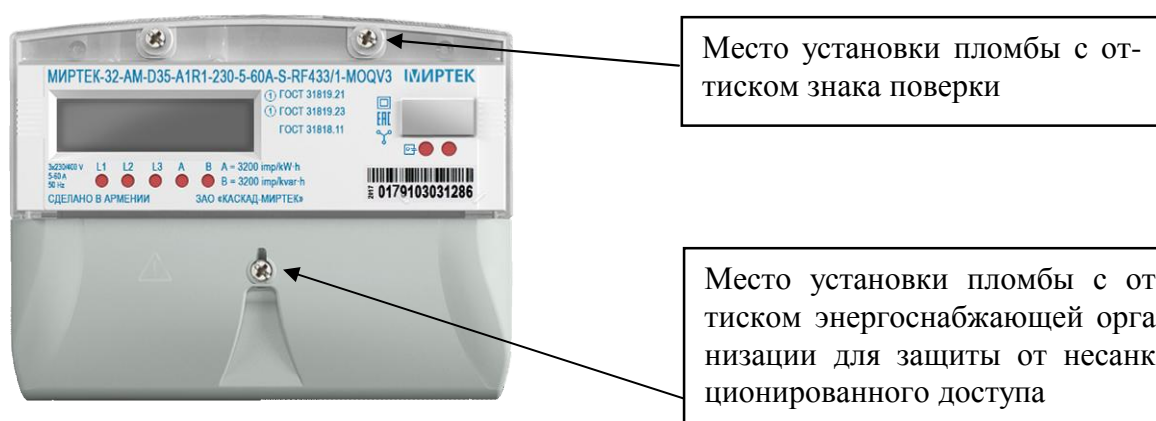
Рисунок 7 – Общий вид счетчика и схема пломбировки от несанкционированного доступа в корпусе типа D35