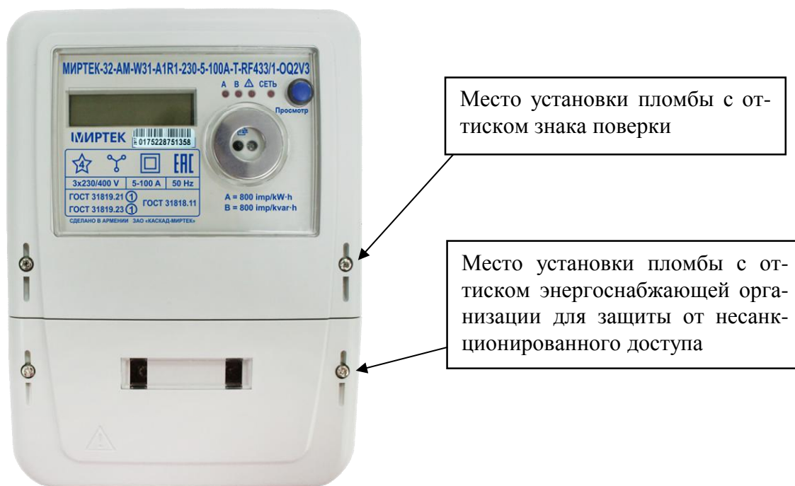
Рисунок 1 –Общий вид счетчика и схема пломбировки от несанкционированного доступа в корпусе типа W31