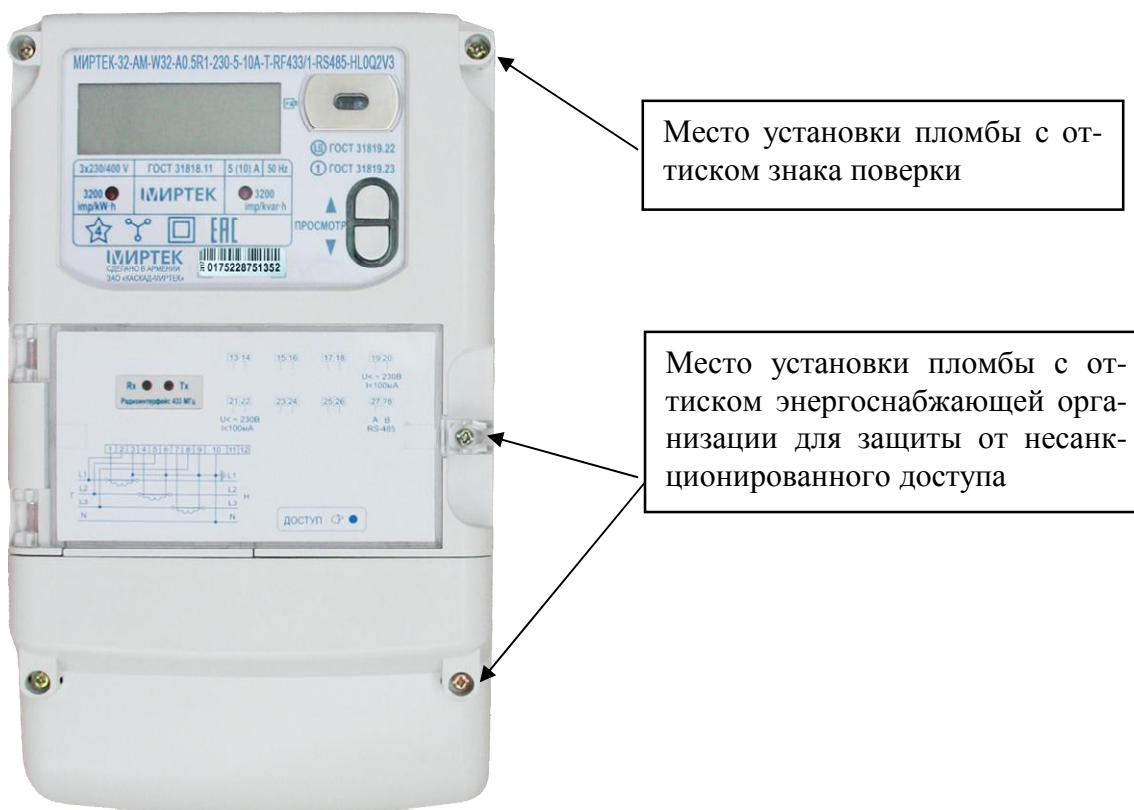
Рисунок 2 – Общий вид счетчика и схема пломбировки от несанкционированного доступа в корпусе типа W32